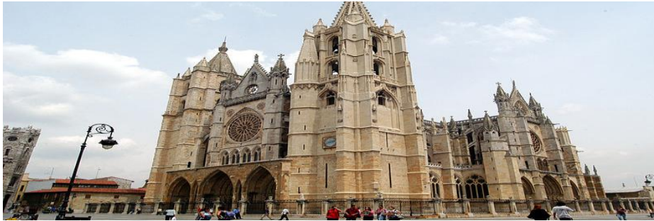
Catedral de León

17,30 h. Regreso al Hotel-Parador por la LE 6511 hacia la A66 dirección León o por la N630. Tarde libre (compras en la ciudad, visita catedral, etc.)