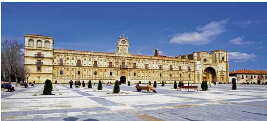
Hostal San Marcos

Con las donaciones de sus caballeros y los beneficios de sus gestas militares, la Orden acumuló rápidamente propiedades en Castilla, León y Portugal. Entre ellas, un convento leonés llamado San Marcos, que acabó convirtiéndose en cabeza de la institución en el Reino de León y que hoy alberga uno de los Paradores monumentales más extraordinarios de cuantos existen.